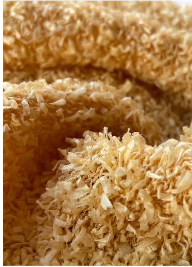
Papillon - 1/8nm, 55% Cupro Paper, 铜氨纸 45% 锦纶

铜氨纤维凭借其众多优异性能，成为可持续时尚领域的理想选择。它可生物降解、可堆肥，对环境友好，是环保设计的完美材料选择。同时，它具有高度透气性与舒适度，以及优异的吸湿性能，即使在温暖气候中，也能保持清爽干燥。其丝滑的奢华质感，触感极佳；良好的抗皱性能减少了熨烫需求；出色的耐热性能则可以满足加工需求；而卓越的染色能力带来鲜艳且均匀的色彩，这让铜氨纤维在可持续时尚中脱颖而出。