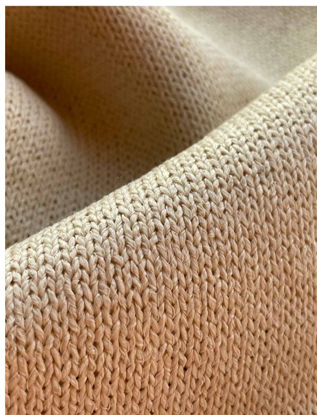
Velvic-62 - 1/6.2nm, 32% Cupro Paper, 铜氨纸 47% 棉 21% 人造丝

如今，纸纱因其多样的原料来源和价格范围，已在市场上得到广泛应用。为了满足客户的需求，贝石特山提供中国纸纱和日本和纸两种选择。然而，公司更加专注于日本和纸纱，因为其在质量和耐用性方面具有明显优势。