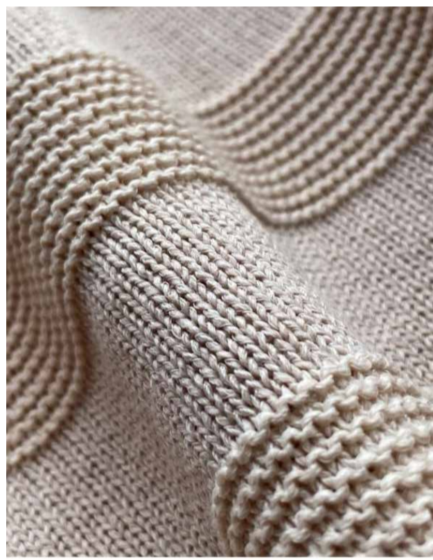
Velvic-12 - 1/12nm, 32% Cupro Paper, 铜氨纸 47% 棉 21% 人造丝

作为行业领导者，贝石特山始终以创新和可持续发展为核心，通过先进技术与环保材料满足行业的高标准需求。