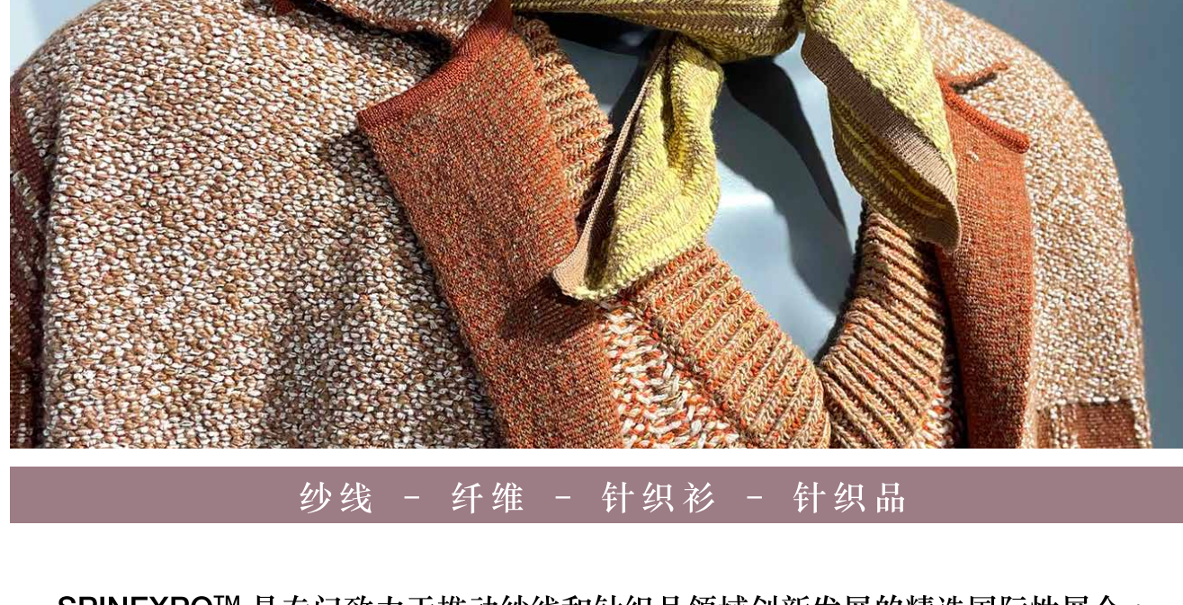
纱线 - 纤维 - 针织衫 - 针织品